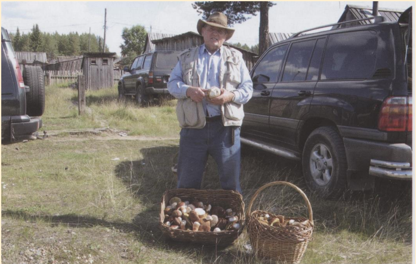
После сбора грибов