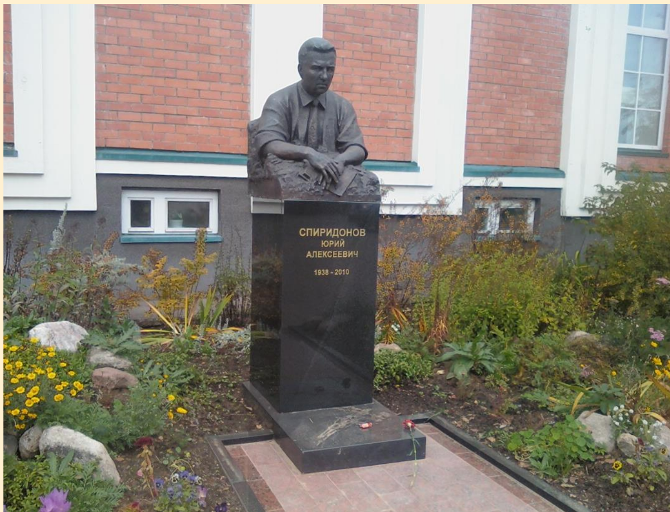
Памятник Ю. А. Спиридонову в Сыктывкаре перед зданием Гимназии искусств при Главе Республики Коми имени Ю. А. Спиридонова