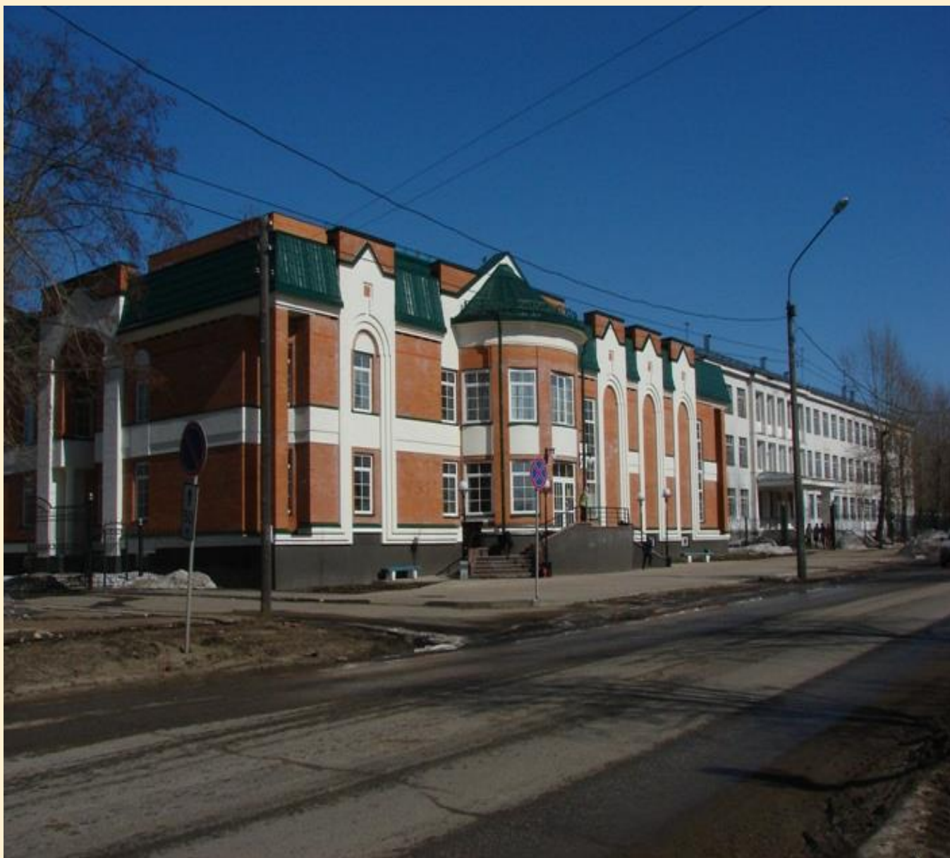
Гимназия искусств при Главе РК им. Ю. А. Спиридонова